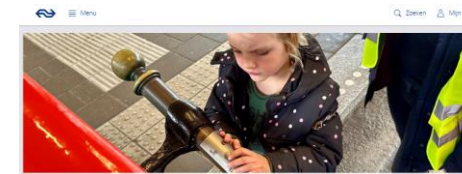
Over NS / Nieuws Slechtziende en blinde kinderen oefenen met reizen met de trein