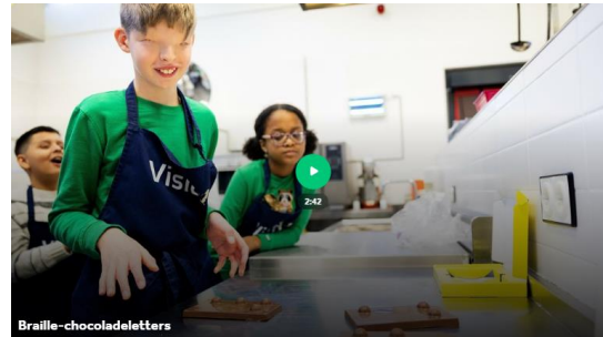
NOS Jeugdjournaal Blinde en slechtziende kinderen maken ch...

Apps Keep Going is een nieuwe Nederlandse sportapp voor iedereen